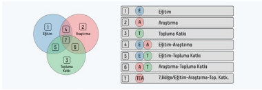
Şekil 1. Atatürk Üniversitesi Eğitim, Araştırma ve Toplumsal Katkı Harmanlama Modeli

Atatürk Üniversitesi farklılaşma stratejisini belirlemiş ve konum tercihinin yapmıştır. Atatürk Üniversitesi; konum tercihi olarak yeni nesil üniversite vizyonu çerçevesinde eğitim, araştırma ve topluma katkı işlevlerini bütünleştirmeyi öngörmektedir (Şekil.1).